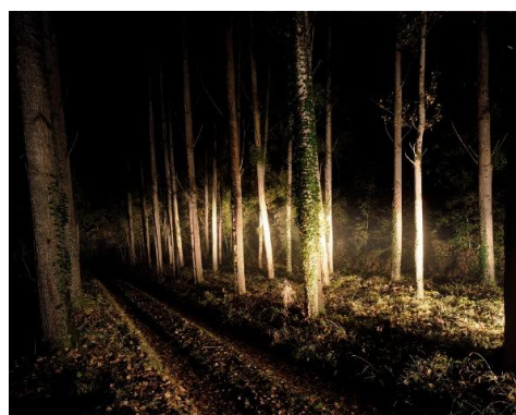
Frédéric Delangle – Nyctalope