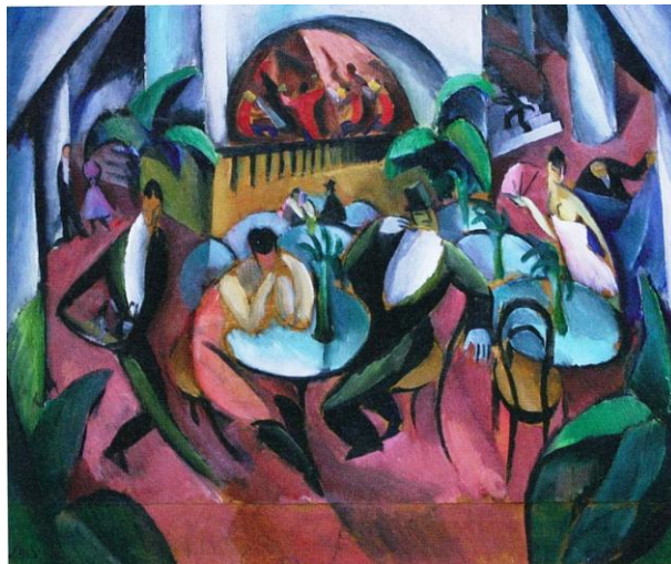
Vie de café , 1916

disponibles sur les pages presse de www.maisondudanemark.dk