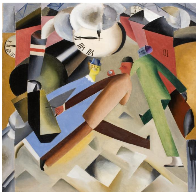
Départ ! , 1918 Fulgsang Kunstmuseum

Michael Bjørn Nellemann Conseiller culturel et de presse