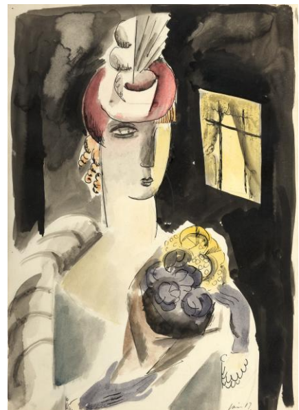
Nuit , 1917

Organisé par le service culturel de l'Ambassade de Danemark