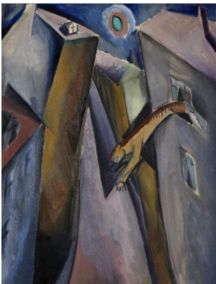
Le rêve , 1917