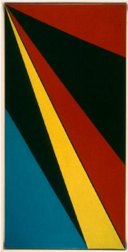
Baertling – Odir , 1957