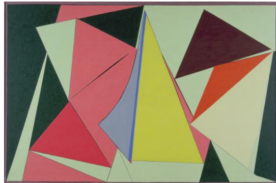
Mortensen – Hommage à A. Herbin , 1960

Pour une demande d'informations complémentaires ou de visuels en haute définition , merci de contacter le service de presse de l'Ambassade de Danemark :