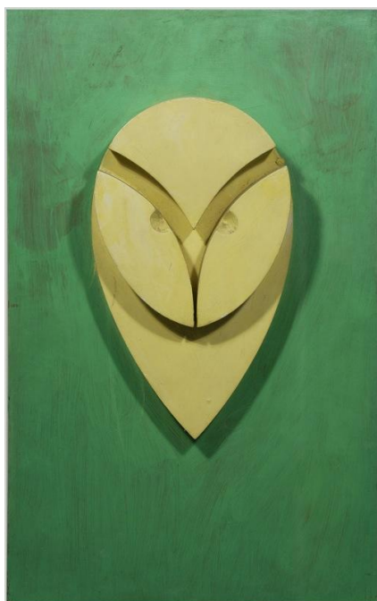
Arp – le hibou , 1963

Espace Marais 22 rue Charlot – Paris 3 Tél. 01 48 87 73 94 Fax. 01 48 87 73 95 www.deniserene.com