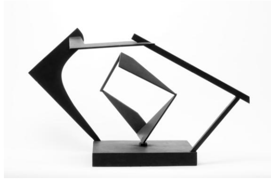
Jacobsen – Problème de forme , 1953