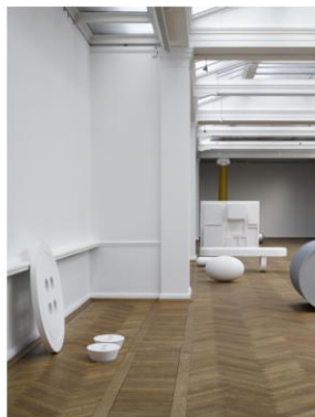
Fra Hexa til Våsen , Ny Carlsberg Glyptotek 2007