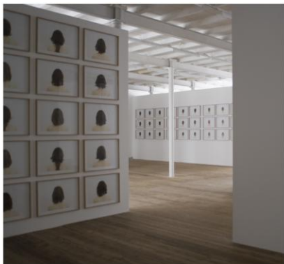
Dog and Die , Kunsthallen Brandts, 2008

142, avenue des Champs-Élysées, 2 e étage. Paris 8 e www.maisondudanemark.dk