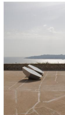
Shells of Mirrors , ART FAB, Saint Tropez, 2006