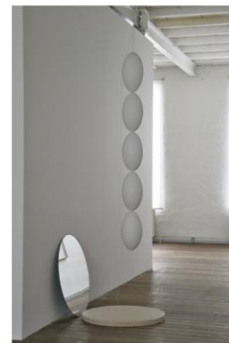
Dance Beads , 2008

Contacts presse et informations : mersou@um.dk Visuels h te définition disponibles sur les pages presse de www.maisondudanemark.dk Pour plus d'informations : www.kalkau.dk