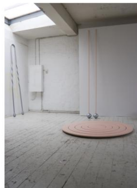
Part of the Mill , 2009