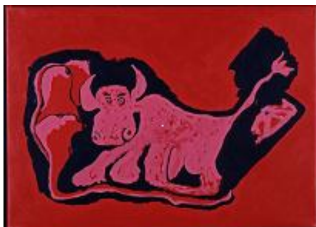
" Un taureau est arrivé en ville ". Erik G. J.

Visuels haute définition disponibles sur les pages presse de www.maisondudanemark.dk