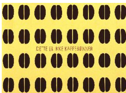
" Ce ne sont pas des grains de café ". Poul P.