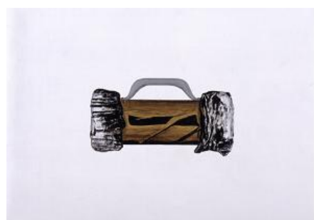
Machine à café – prototype 1 : 1 ". Erik G. J.