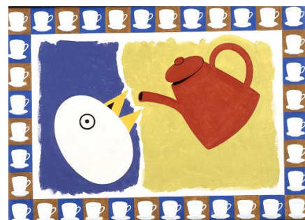
" Une tasse de thé – Erik ? ". Poul P.