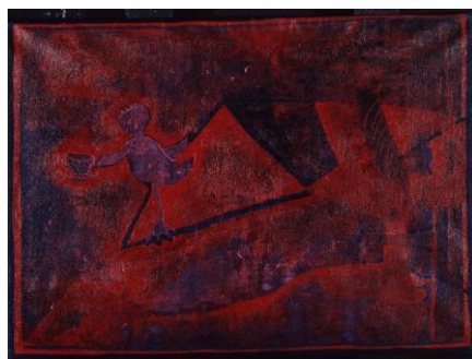
"Quand je fulmine je bois du café ". Erik G. J.