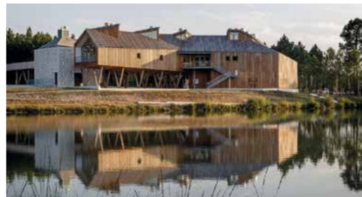
  APM architecture