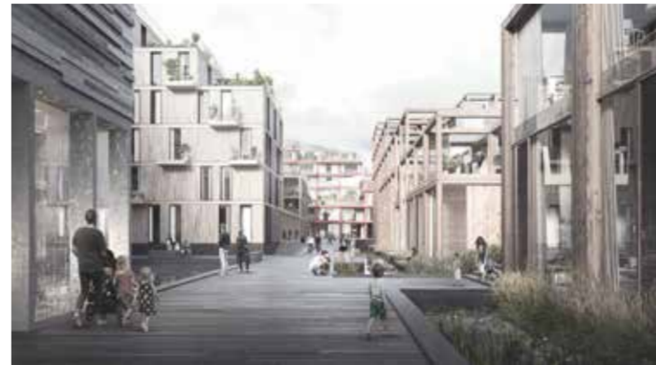
  Lendager Group

Deux entreprises engag es dans l'architecture durable sont au programme de cette nouvelle soir e #arkitektur. Lendager Group est une agence danoise innovante sp cialis e dans la construction durable avec un accent particulier sur l' conomie circulaire. Leur projet en cours de construction le UN17 Village, dans le quartier de  restad   Copenhague est le premier projet de construction au monde   traduire les 17 objectifs mondiaux de d veloppement durable de l'ONU en actions concr tes. De son c t , l'architecte et urbaniste fran ais, Philippe Madec , fondateur de APM architecture, est l'un des pionniers de la construction  cologique en France, et l'un des initiateurs du Manifeste pour une frugalit  heureuse et cr ative qui engage le monde de la construction et de l'am nagement   sortir du gaspillage en  nergie et en ressources de toutes sortes. Programme de la soir e : projection du documentaire Vi bygger det v k (28 minutes) et conf rence avec les architectes Philippe Madec et Niklas Nols e.